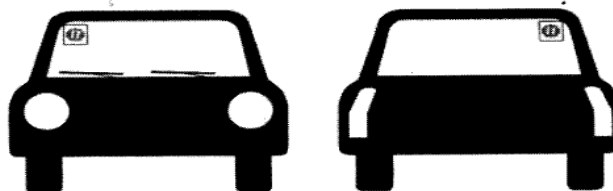
цртеж бр. 2